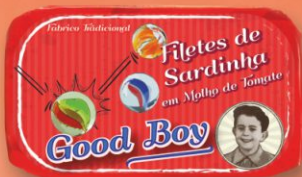
Filety sardinky v paradajkovej omáčke