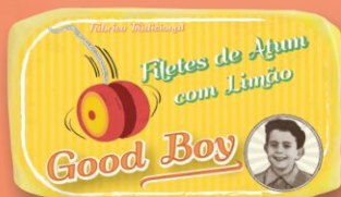
Filety tuniaka v olivovom oleji s citrónom