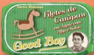
Filety atlantickej stavridy v olivovom oleji s cesnakom a petržlenovou vňaťou