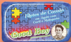
Filety makrely v olivovom oleji s karí a čili