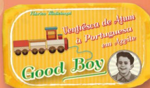
Ventresca filety z brušnej časti tuniaka na portugalský spôsob s olivovým olejom