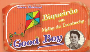
Ančovičky v jemnej marináde Escabeche